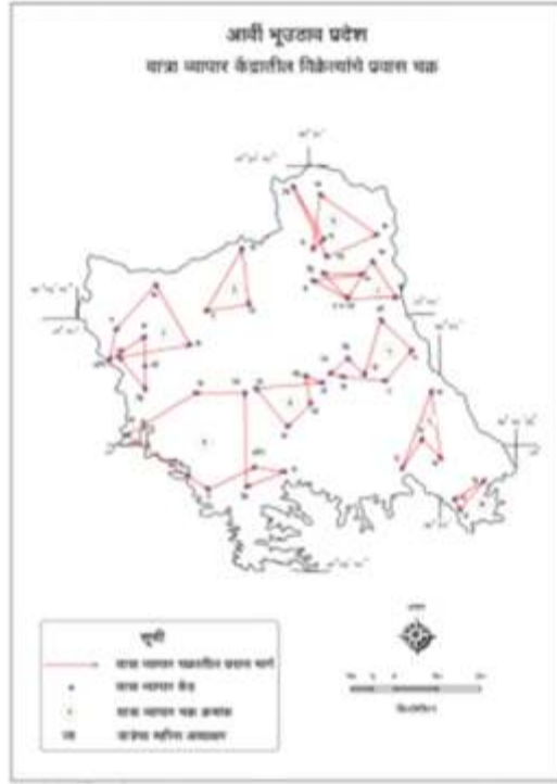
उदक"क Ø 2

आर्वी भूउठाव प्रदेशातील नैऋत्य भागामध्ये असलेल्या या यात्रा व्यापार चक्रामध्ये एकूण 07 यात्रा केंद्रांचा समावेश होतो. त्यामध्ये येणगाव, मालेगाव (काली) टाकरखेडा, कवाडी, दानापूर, महाकाली, बोथली (हेटी) ही यात्रा केंद्र आहेत. यापैकी महाकाली येथे 9, टाकरखेडा येथे 7 व मालेगाव (काली) येथे 2 दिवसांची यात्रा भरते, या यात्रा व्यापार चक्रामध्ये दोन यात्रा केंद्रांमधील सरासरी अंतर 14.15 कि. मी. आहे.