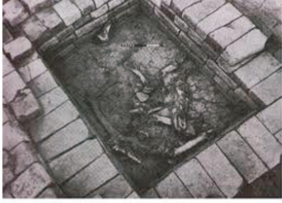
चित्र सं. 3