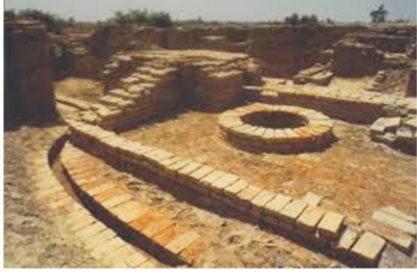
चित्र सं. 2

सिन्धु-सरस्वती सभ्यता: कालीबंगा के विशेष सन्दर्भ में